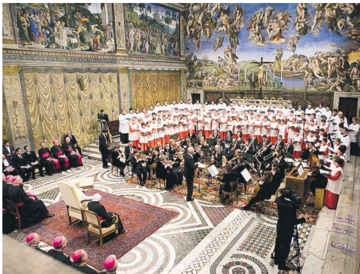
Die Regensburger Domspatzen am Samstag in der Sixtinischen Kapelle. Vorn links: Papst Benedikt XVI. und sein Bruder Georg Ratzinger, der am 15. Januar 85 Jahre alt wurde